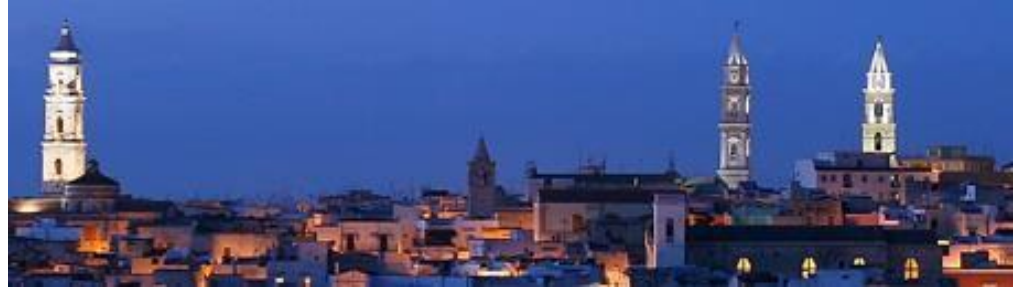
Immagine di testata

L'immagine di testata deve avere dimensioni minime di 1920 x 409 px . Deve essere sviluppata in orizzontale e deve avere una buona qualità. Se l'immagine non rispetcia le dimensioni indicate, sarà ritagliata e adattata, perdendo qualità.